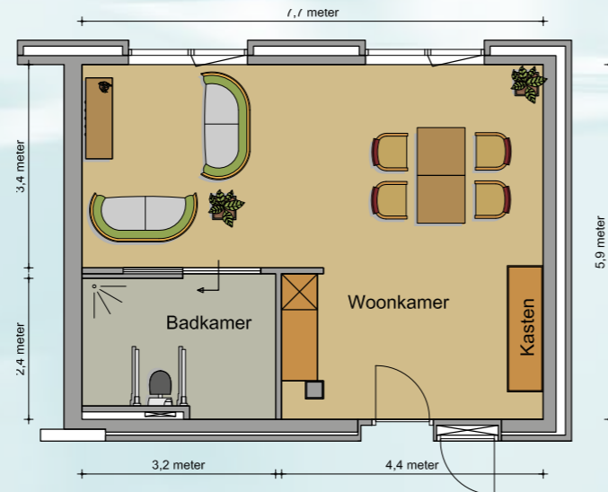
Kortverblijfkamer Oppervlakte ± 59m 2